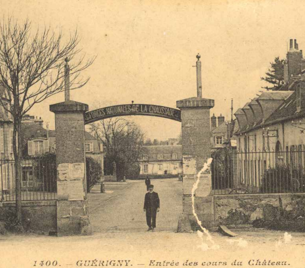
1400. — GUÉRIGNY. — Entrée des cours du Château.